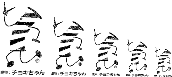
愛称：チヨキちゃん