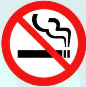
多くの施設において 原則屋内禁煙に

2019年7月から、病院や学校、行政機関で原則敷地内禁煙のルールがスタートしました。そして2020年4月、飲食店やオフィス・事業所などでも、原則屋内禁煙となるほか、20歳未満の方の喫煙エリアへの立入禁止などを加えた改正健康増進法が全面施行されます。