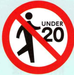
20歳未満の方は 喫煙エリアへ立入禁止に