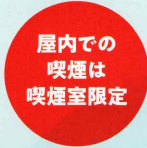
屋内での喫煙には 喫煙室の設置が必要に