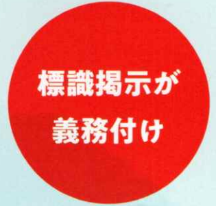
喫煙室には 標識掲示が義務付けに