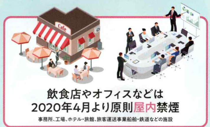
飲食店やオフィスなどは 2020年4月より原則屋内禁煙