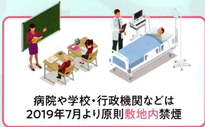
病院や学校・行政機関などは 2019年7月より原則敷地内禁煙